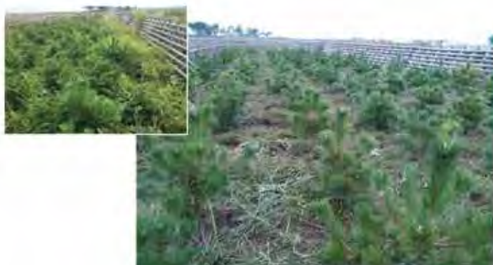
海岸防災林の除草(左上:作業前、右作業後)