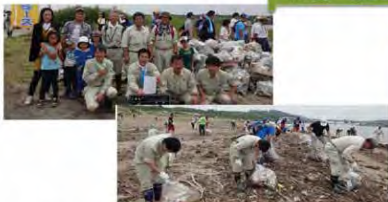
河川敷のクリーンナップキャンペーン継続参加