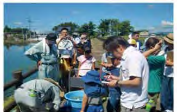
子供達へ貴重種であるゼニタナゴやアカヒレタビラなどを紹介する講師