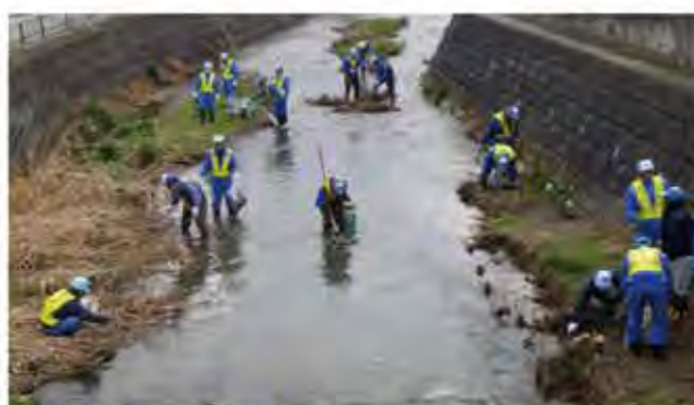
ふるさとの川愛護活動