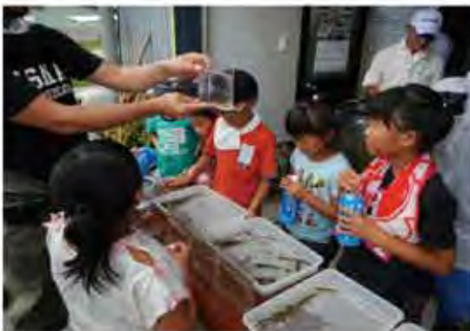
子供達と周辺に生息する水生生物から地域の環境を調査!!