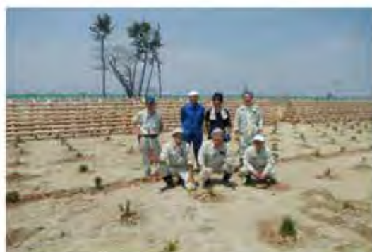
海岸防災林再生に向けた植林活動