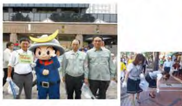
ポイ捨て防止の啓発と清掃活動