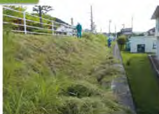
近隣学校斜面の草刈