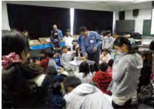
小学校での地質・地盤の出前授業