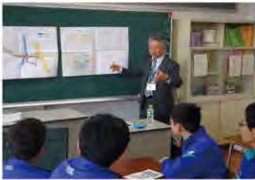
社会資本整備についての講座と測量実習の様子