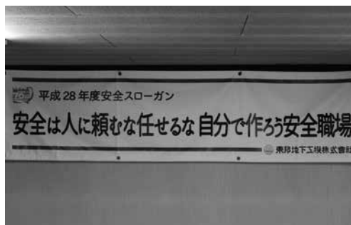
【社内安全大会スローガン】