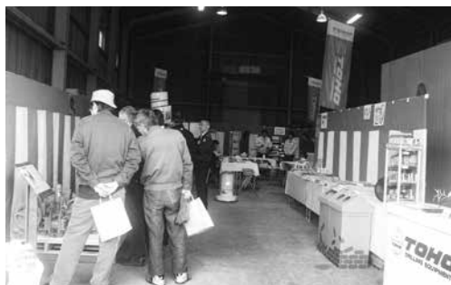
【仙台営業所 展示会 会場】