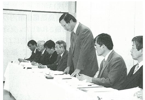
東北地質調査業協会側

当協会では今回の意見交換会に先立ち、東北地方整備局に対する質問事項や要望事項、提案事項などを資料としてまとめ、約1ヶ