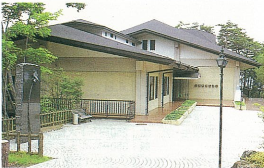
宮 沢 賢 治 記 念 館

賢治が昭和8年、37歳の若さでこの世を去ってから50年後の昭和57年9月に記念館は開館しました。生前あまり有名ではなかった賢治の作品が、今では小学校・中学校・高等学校の教科書にまで紹介されるようになり、幅広い年齢層の方々が、全国各地から宮沢賢治記念館を訪れております。